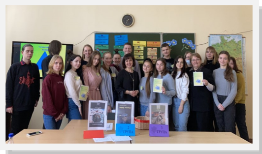
Мастер-класс по языкознанию